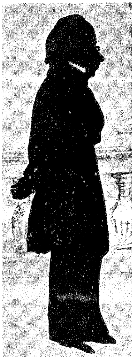
צללית של יצחק ליסר, עורך ה"אוקסידנט"